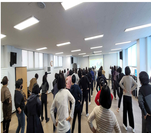
‘찾아가는 성폭력 예방교육’ 강의 사진 1